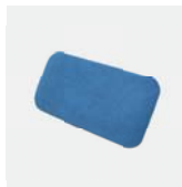
Blazina naslonjala PTR Št. izdelka 975 104