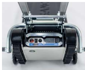
Nadzorna plošča na osnovni enoti