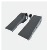
Rampa PTR Št. izdelka 975 103