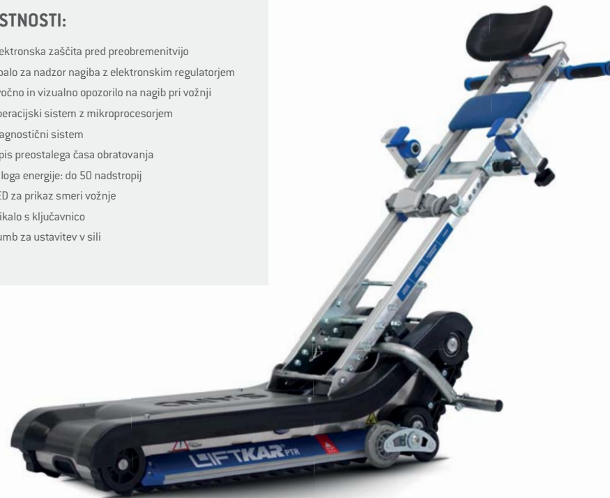
Naprava z dodatno opremo in zlozljivo oporo za invalidski voziček.

LIFTKAR PTR je mobilna enota, posebej razvita za obratovanje na ravnih stopnicah. Uporabniki invalidskih vozičkov so pri svojem gibanju manj omejeni, pomočniki pa bodo razbremenili svoj hrbet.