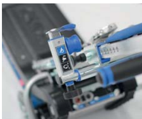
Nastavljiva sponka naslonjala