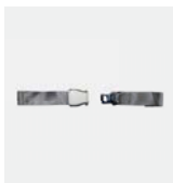
Trebušni pas PTR Št. izdelka 075 105 (nepremična pritrditev)