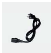
Napajalni kabel PTR Št. izdelka 075 664