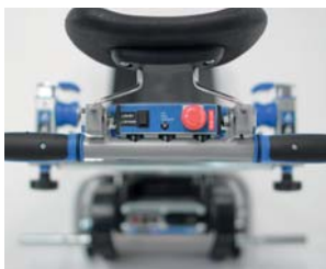
Nadzorna plošča na ročaju